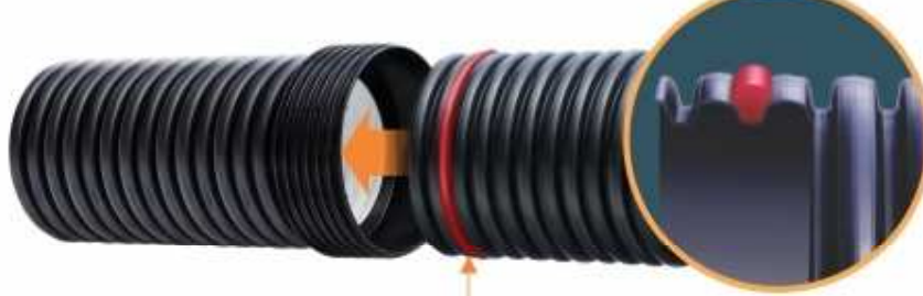
Anel Vedação de Borracha