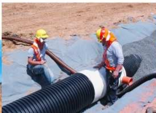
Disponibilidade de acessórios. Fabricação de conexões e peças especiais.