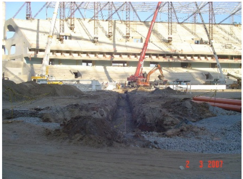
FOTO 2 Escavação das trincheiras drenantes do sistema de drenagem secundário (espinha de peixe).