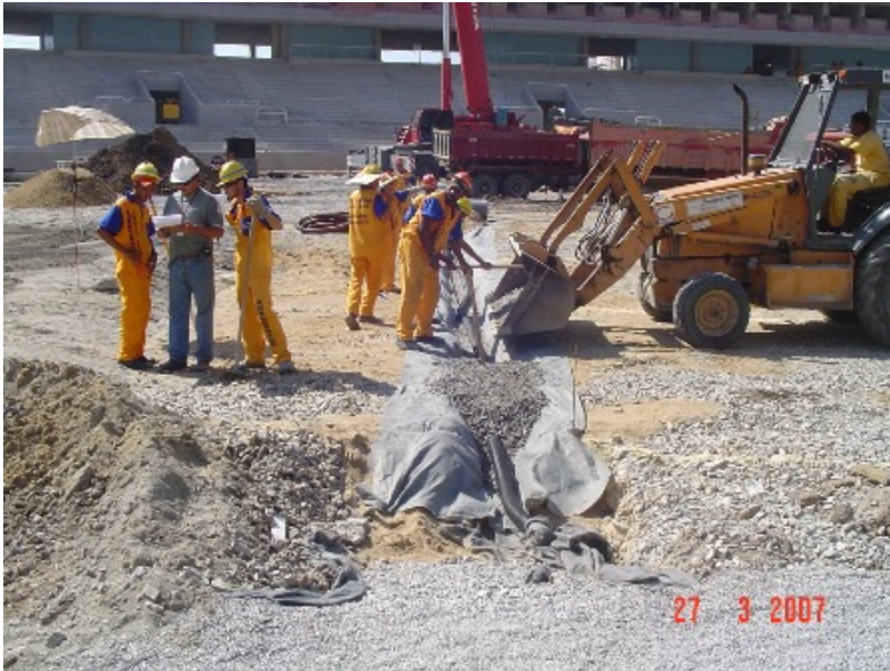
FOTO 5 Preenchimento das trincheiras drenantes com material granular (brita).