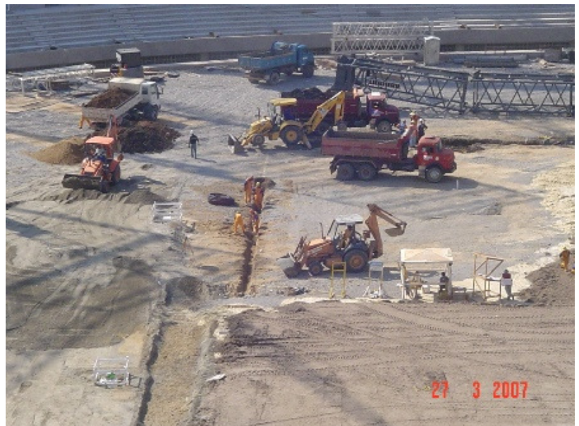
FOTO 6 Vista geral do sistema de drenagem secundário, tipo espinha de peixe.